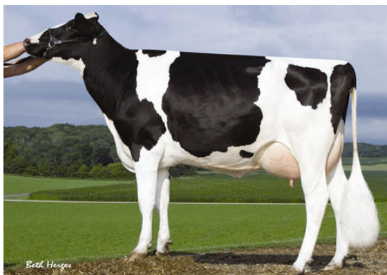
SANDY-VALLEY PLANE SAPPHIRE FIFTH DAM